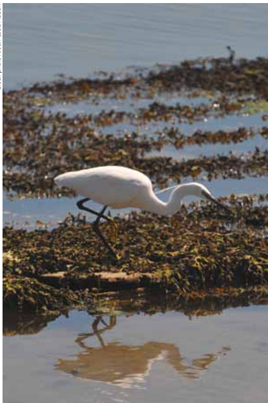
L'aigrette garzette fréquente les milieux aquatiques pour se nourrir.